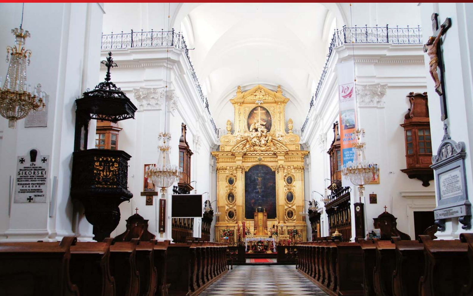
ショパンの心臓が眠る聖十字架教会内。

世界的に最も権威あるコンクールの1つ、フレデリック・ショパン国際ピアノ・コンクール。 5年に一度のスター誕生の瞬間に貴方も立ち会いませんか？ チケットはセカンドカテゴリー（一部ファーストカテゴリー）を確約。 コンクール会場から徒歩圏のホテルにご滞在いただきます。全コース添乗員同行。