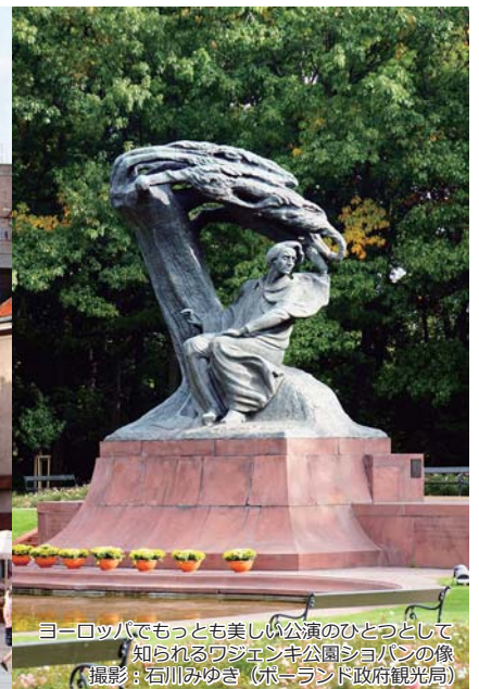
ヨーロッパでもっとも美しい公演のひとつとして知られるワジェンキ公園ショパンの像