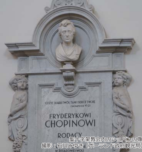
聖十字架教会内のショパンの像