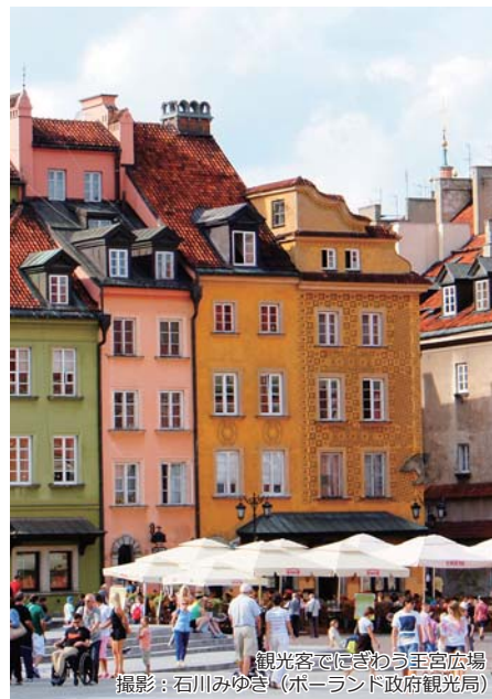
観光客でにぎわう王宮広場