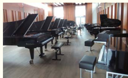
ベーゼンドルファーショールーム

1年で300台しか生産されない手作りのピアノの製造工程を見学します。ショールームでは試弾もできます。