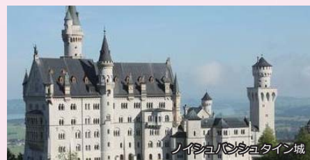
ノイシュバンシュタイン城

ディズニーランドのシンデレラ城のモデルとなった白亜のノイシュバンシュタイン城、ロココ建築の最高傑作、世界遺産にもなっているヴィース教会にご案内します。